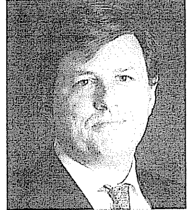
Carlos de Cárdenas